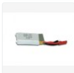
Image not readable or empty kameras/eaglecam8.jpg kameras/eaglecam8.jpg

NEU! Die vielleicht kleinste Funkkamera der Welt: Eagle 1!