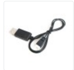
Image not readable or empty kameras/eaglecam8.jpg kameras/eaglecam8.jpg